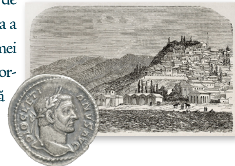
Vedere din trecut a Nicomidiei (astăzi Izmit), capitala Imperiului Roman

pentru a-și lua rămas-bun de la soția sa. Când l-a văzut acasă, neștiind de hotărârea judecătorului, Natalia l-a numit laș, citând un fragment din Evanghelia de la Matei: „Iar de cel ce se va lepăda de Mine înaintea oamenilor și Eu Mă voi lepăda de el înaintea Tatălui Meu, Care este în ceruri” (10, 33). După ce Adrian i-a explicat motivul pentru care venise, Sfânta Natalia l-a îmbrățișat și i-a spus că va sta lângă el până la moarte. Adrian a fost martirizat împreună cu ceilalți 23 de creștini. Sfânta Natalia a locuit cu un grup de femei evlavioase aproape de mormântul soțului său până la propria moarte.