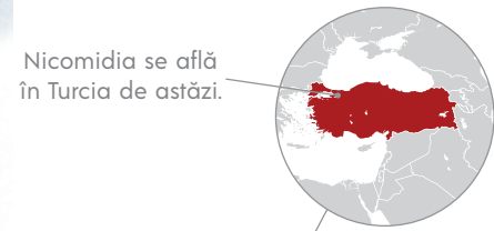
Nicomidia se află în Turcia de astăzi.

Sfinții Adrian și Natalia erau căsătoriți de doar 13 luni când Adrian a primit cununa muceniciei. Adrian a ținut-o pe Natalia de mână chiar și înaintea morții, călăul fiind nevoit să o rețeze. Ea a reușit să i-o recupereze, ascunzând-o într-o haină de-a sa.