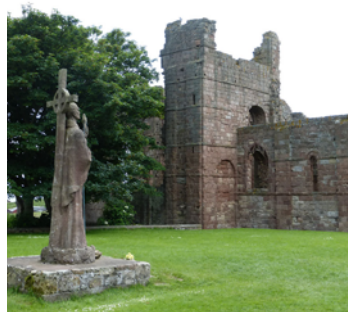
Sus: ruinele mănăstirii din Lindisfarne și statuia Sfântului Aidan Dreapta: o pagină din Evanghelia de la Lindisfarne

întâi lucrurile simple, și apoi încetul cu încetul aduși la deplinătatea credinței. Părinții s-au minunat de discernământul lui Aidan, l-au hirotonit episcop și l-au trimis în Northumbria. Aici, el a întemeiat o mănăstire pe insula Lindisfarne și a călătorit în tot cuprinsul Northumbriei, propovăduind Evanghelia în locuri publice și în casele oamenilor și ridicând biserici. Sfântul Aidan a murit în pace în anul 651 și a fost înmormântat pe insula Lindisfarne.