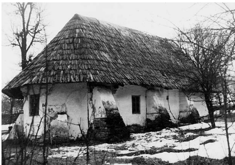
Biserică medievală, construită din lemn ce amintește de biserica veche din Bărboși, strămutată în Cogeasca Veche la mijlocul secolului al-XVI-lea.

cu simplitate, cu naturalețe, fără ostentație, într-o sobrietate încântătoare. Preotul, chiar când nu excela prin cântare și predică, era urmărit cu atenție de credincioși. El predica prin viața sa „ de om rătăcit ” între enoriașii săi. Cât despre icoane, se pictau doar câteva mai deosebite din catapeteasmă, iar altele se agățau pe pereții de lemn căptușit la încheieturi cu câlți de cânepă.