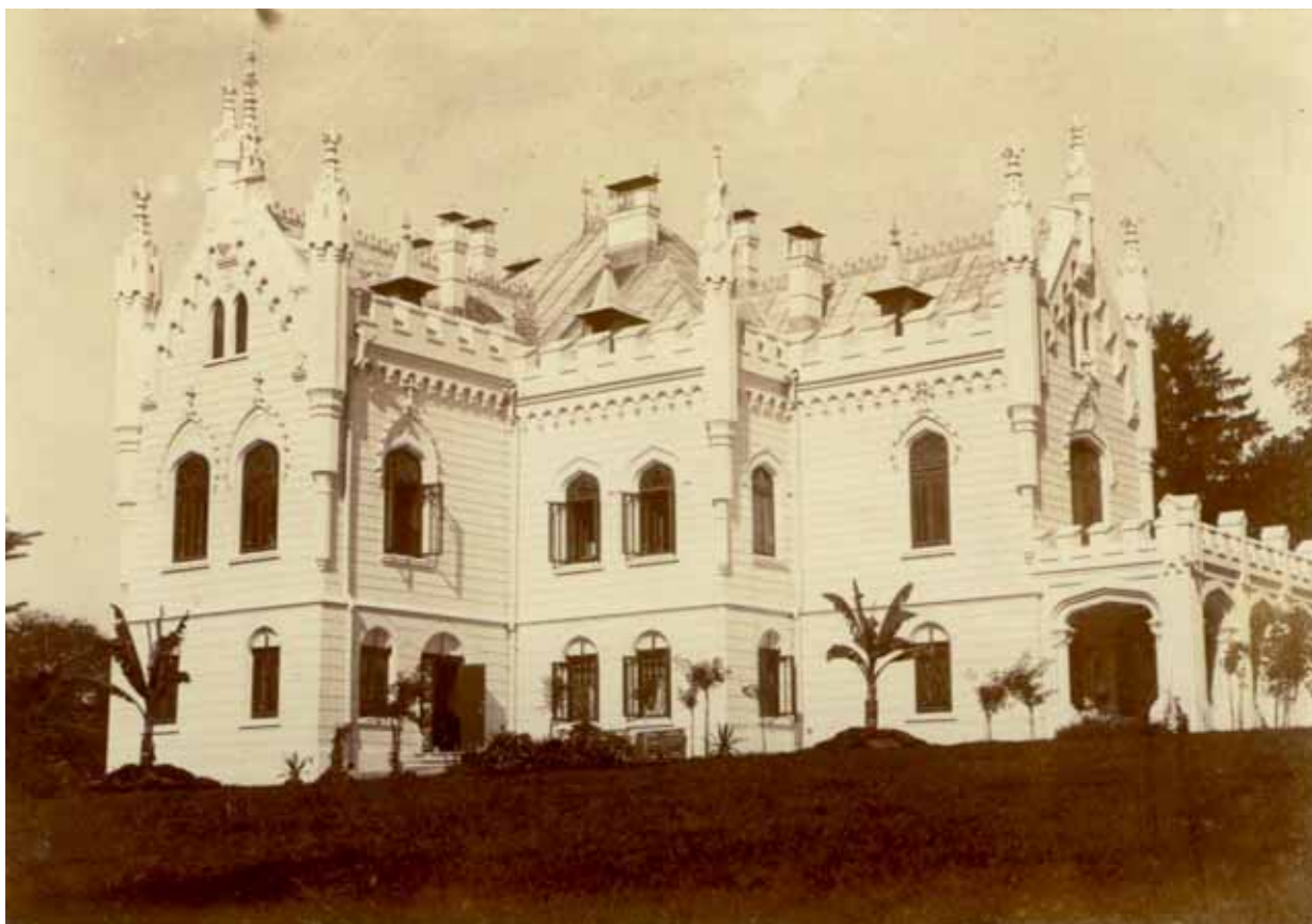
2 – Fațadele castelului, înainte de a primi stucaturile heraldice (a. 1900).