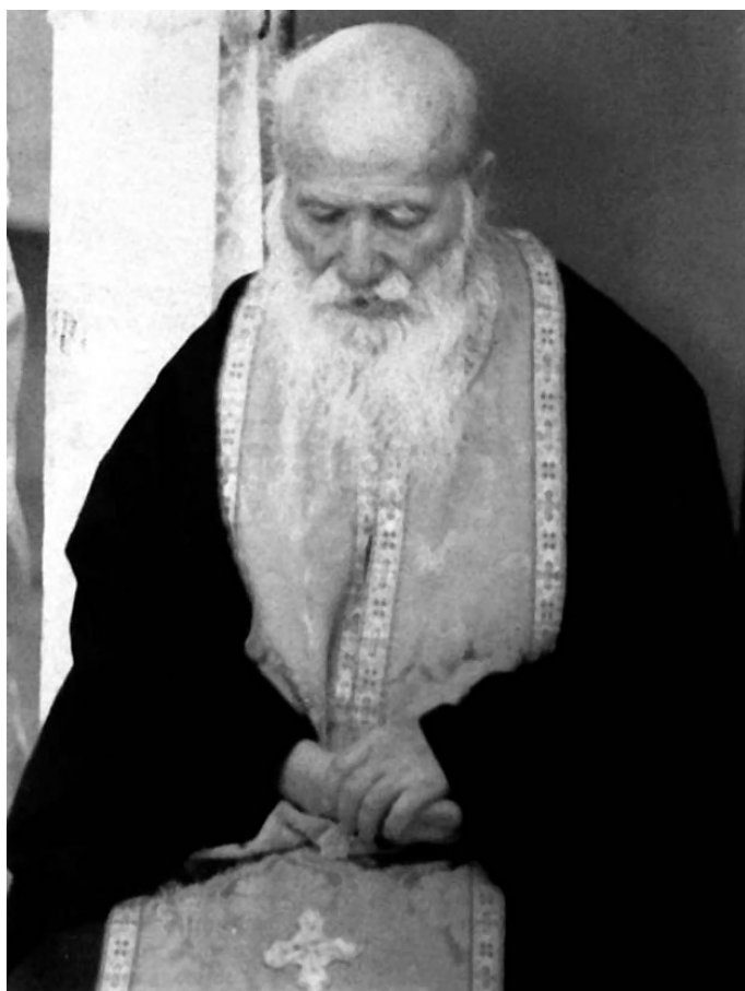
Sfântul Porfirie în scaunul de spovedanie