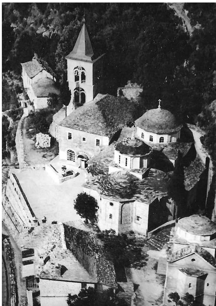
Biserica Schitului Kavsokalivia la mijlocul secolului trecut