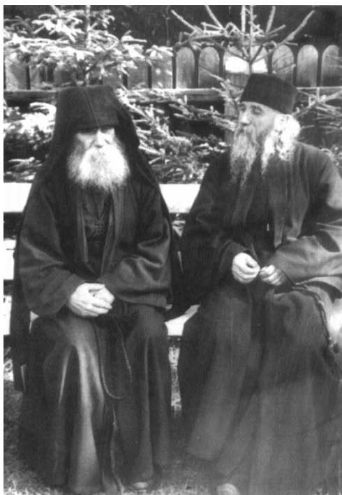
Arhimandritul Cleopa și ieroschimonahul Paisie la sfat de taină în cimitir

Sfinții Părinți spun: „Cine vrea să se mântuiască, cu întrebarea să călătorească”. Sfatul bun te va păzi și cugetul drept te va apăra. Frate pe frate ajutorându-se și sfătuindu-se, sunt ca o cetate bine întemeiată și ca o împărăție nebiruită.