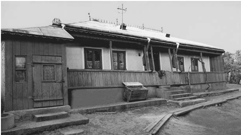
Casa părintească a Părintelui Cleopa

Casa lor era ca o biserică, precum povestea Părintele Cleopa: „Aveam o cameră toată numai cu icoane. Un fel de