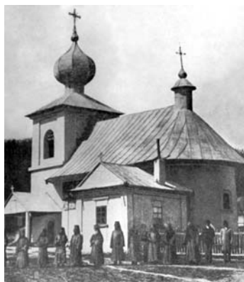
Schitul Cozancea în anii 1925-1935