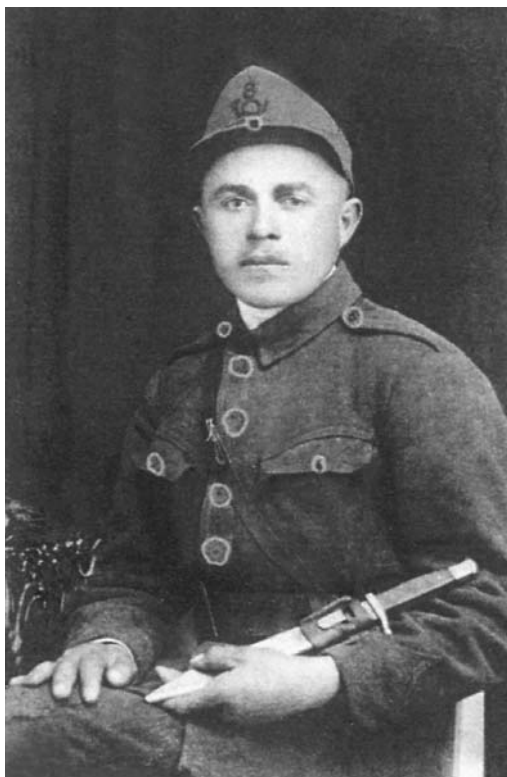
Fratele Gheorghe în armată la Cernăuți

Atunci egumenul l-a rânduit cu ascultarea la vitele schitului.