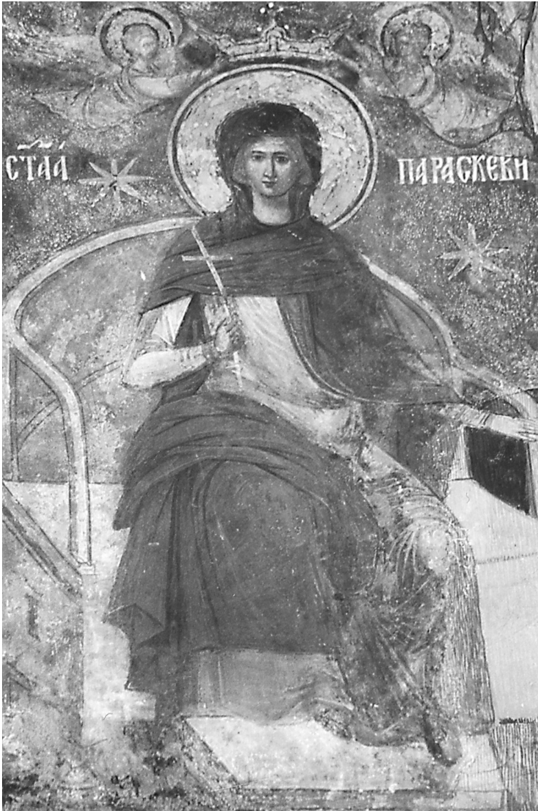
Sfânta Cuvioasă Parascheva, frescă din Catedrala Arhiepiscopală din Roman, sec. XVI