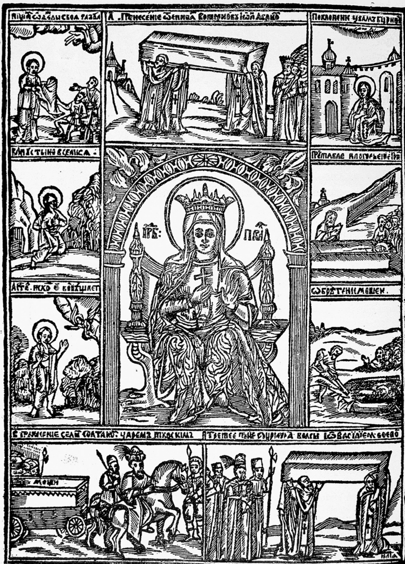
Scene din viata Sfintei Cuvioase Parascheva in „Cazania” lui Varlaam, 1643