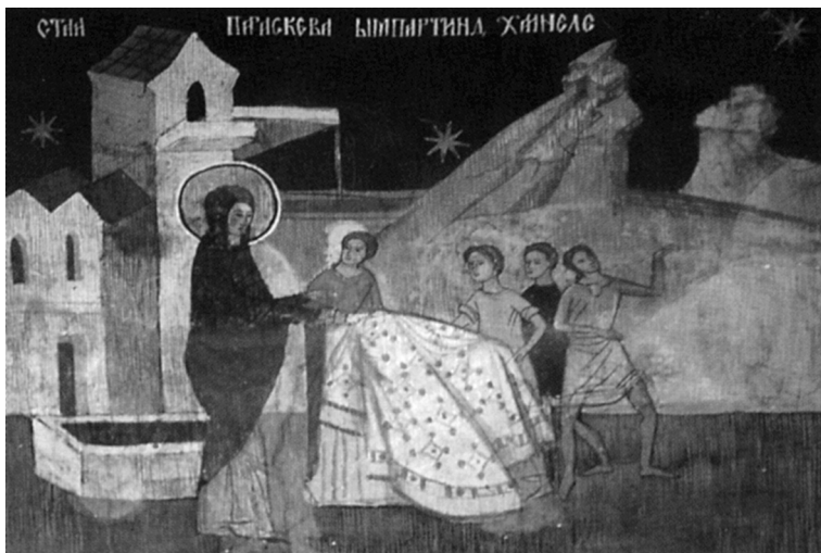
Sfânta Parascheva oferindu-și ca milostenie hainele. Frescă din Catedrala Arhiepiscopală din Roman, sec. XVI