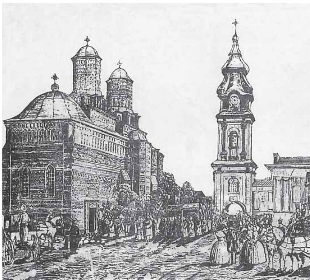
Mănăstirea "Sfinții Trei Ierarhi" stampă de epocă, 1845